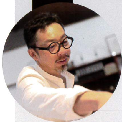
家づくりを始める前に ライフプランをしっかりと

詩音建築では、人生設計から家づくりを始めていただき、本当に良い家を創るために、どの工程も手を抜きません。ただ家を買っていただくのではなく、共に創り上げるという気持ちで取り組みます。